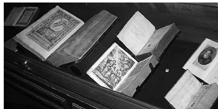
Az örmény könyvnyomtatás remekei a Távól az Araráttól – Örmény kultúra a Kárpát-medencében c. kiállításon

dig azzal az indoklással, hogy Yovhannes pátriárka nem őszintén unitus, és katolizálása ellenére továbbra is eretnek és szakadár szokásoknak hódol. Így az Apostoli Szentszékben nem nézték volna jó szemmel, hogy egy katolikus örmény növendéket, egy ilyen bizonytalan, ingadozó hitű fő-