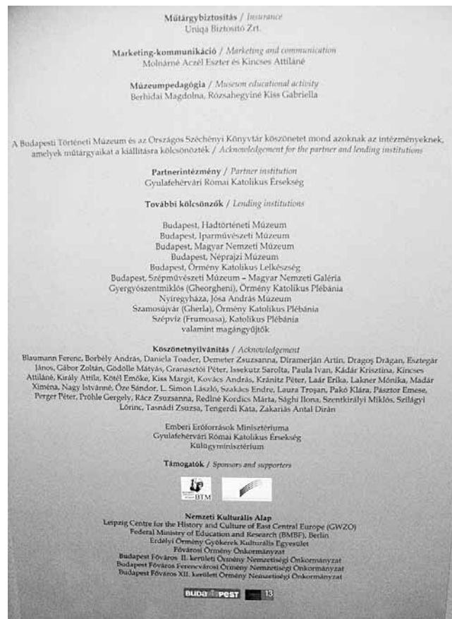
A konferencia információs táblója