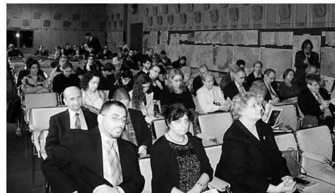
A konferencia közönsége