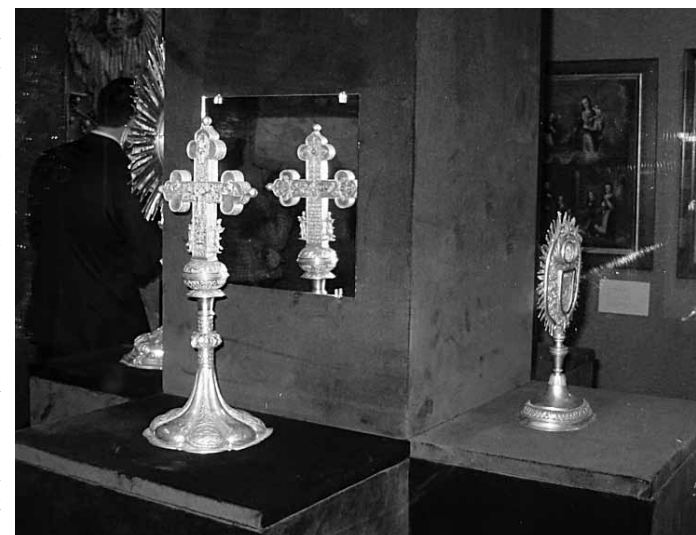
Örmény feliratos kereszt. Szamosújvár, Örmény katolikus plébánia, 1717

Az erdélyi örmények egyházi egyesülése így már elkerülhetetlen folyamat-