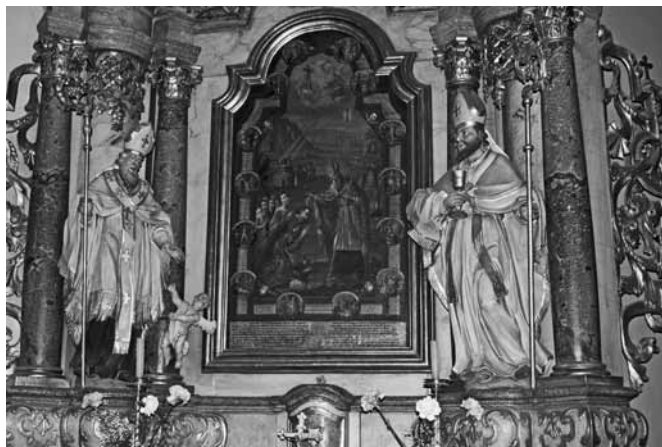
A gyergyószentmiklósi Világosító Szent Gergely oltárkép

Világosító-Szt-Gergely atyja Ánág, Okoh nejjével és gyermekeivel, Örményországban királyi rokonánál keres s talál menedéket a perzsák elől. Okohnak itt néhány hónap múlva fia született, kit keresztény dajkája magával vitt Görögországba, hol, mint árvát, két éves korában megkereszteltette. A kereszttségben Gergely nevet nyert; az árva gyermek keresztény nevelésben részesül, s meglett férfi korában Zsófia, özvegy nevelőanyja kérésére s ajánlataira megnősül. Családi életéből alig telik el két év és máris előkészületeket tesz arra, hogy végrehajtsa azt, mire nejjével, Máriával elhatározták magukat. Ugyanis ez az idő alatt esett tudomására az, hogy atyja ál-