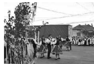
Csernakeresztúron tovább él a májusfaállítás hagyománya

Ezt a földet választottam, ezt a napot úgy akartam!” – az ismert Republic dal idézett