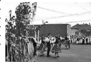
Csernakeresztúron tovább él a májusfaállítás hagyománya

Ezt a földet választottam, ezt a napot úgy akartam!” – az ismert Republic dal idézett