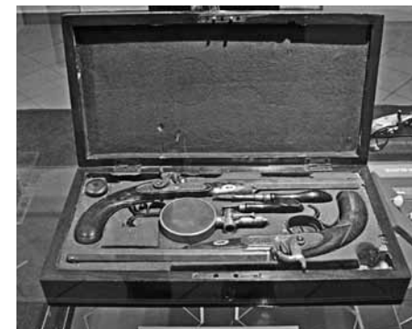
Kiss Ernő pisztolyai

Reméljük, egyszer majd láthatóvá válik a kb. 14.000 darab relikviát összegyűjtött Aradi Ereklýmúzeum teljes anyaga.