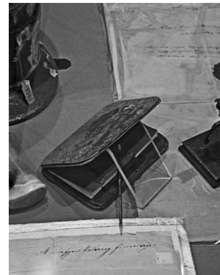
Lázár Vilmos notesza