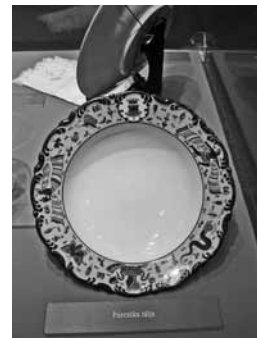
Kiss Ernő porcelán tányérja

Nagy élményt jelentett megtekinteni a kiállított tárgyakat, még ha töredéke is csupán a nagyszámú 48-49-es relikviának. Örülünk, hogy a budapesti közönség számára is láthatóvá vált Pécs és Szeged után. A számtalan relikvia közül most csupán Kiss Ernő aradi vértanúnk személyes használati tárgyai: monogramos tányérok, pohara, monogramos asztalkendője, teáskészlete, pisztolyai és puskái; Lázár Vilmos vértanúnk portréja, kardszíja és kardbojtja, notesze, hadtestparancsnoki kinevezése, ezredesi előléptetése, a IX. hadtest parancsnokának pecsétnyomója