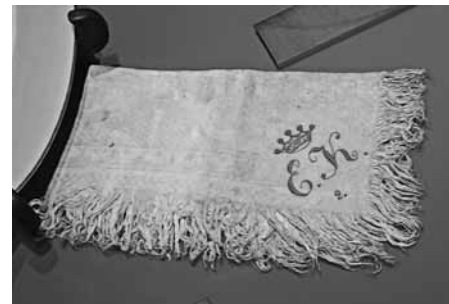
Kiss Ernő monogramos szalvétája