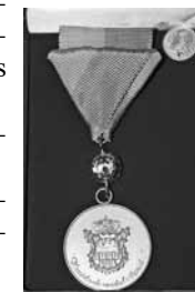
A gyémánttal ékesített „Mákvirág” érem

Viseld büszkeséggel, és emlékeztessen mindig, annyira szeretett HAZÁDRA!, mely hazavár!