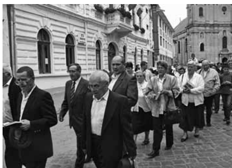
Medgyesi Római Katolikus Kórus