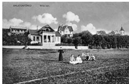
Balatonfüred - Villa sor (korabeli fénykép)