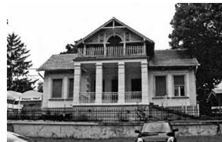
A Dániel-villa ma