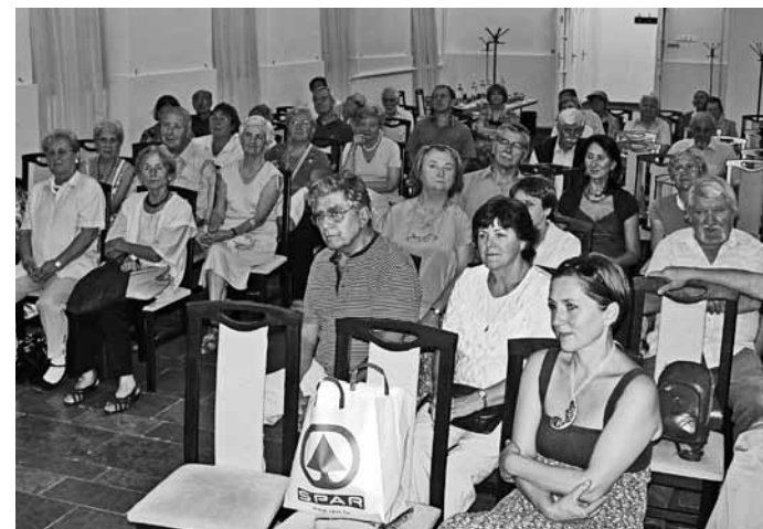
A Nyáry Pál előadóterem hallgatósága