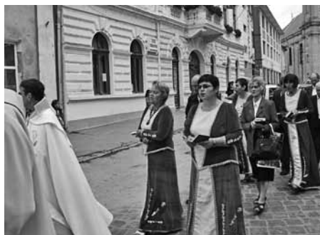
Szamosújvári Örmény Katolikus Kórus