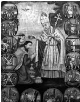
Világosító Szent Gergely – Riti József Attila felvétele

A kiállított képeket két témakörre fűzhetnénk fel. Elsőként bemutatjuk azt a néhány jellegzetesen örmény szentet, akiknek tisztelete az örmény katolikus egyházban is fennmaradt. Az erdélyi örmények asszimilációjának kiemelkedő tényezője volt a katolikus egyházzal kötött unió, amelynek kö-