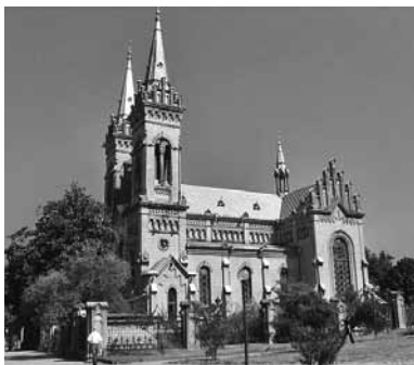
Ortodox templom Batumiban

Elsétáltunk több szép ortodox templomba végigcsodálni az ikonokat és ikonostázokat, végigélni a történeteket, amelyeket ábrázoltak. Az egyik kedvenc ikonunkon fölül Jézus