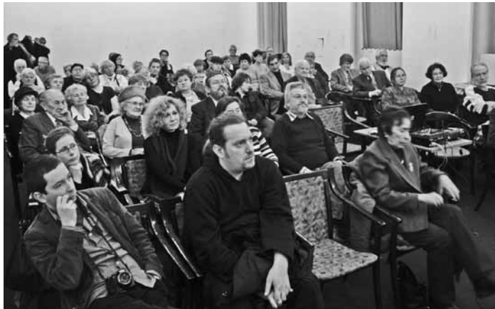
A Fővárosi Örmény Klub januári közönsége

látogathatjuk az ősök fészket, és egy felejthetetlen hangulatot kapunk Erzsébetvárosban, Gyergyószentmiklóson, Szamosújváron azoktól, akik szegről-végről rokonaink.”